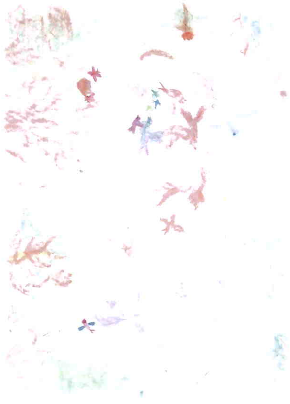
.... a takhle společné dílo vznikalo...