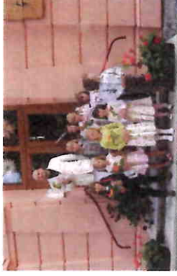
první žáci Wlaštoky v září 2012

Hledala alternativní vzdělání pro své 2 syny, protože nechtěla, aby zažili to, co ona kdysi na klasické škole. Waldorfská pedagogika se jí nesmírně zalíbila, a tak se stalo, že začala učit. Nejprve angličtinu a poté se stala třídní učitelkou.