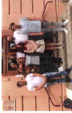
... a v červnu 2021